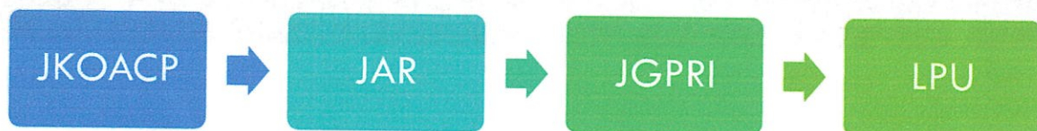
Rajah 3: Mekanisme pelaporan inisiatif OACP

Bagi memastikan keberkesanan dan kelestarian OACP, pelaksanaannya akan dipantau dan dikaji oleh Unit Integriti secara berkala. Kajian semula risiko, strategi dan inisiatif akan dibuat sejajar dengan perubahan semasa dan keperluan strategik UTHM. Dengan cara ini, OACP akan kekal relevan bagi mencapai visi UTHM sebagai universiti teknikal yang bebas rasuah.